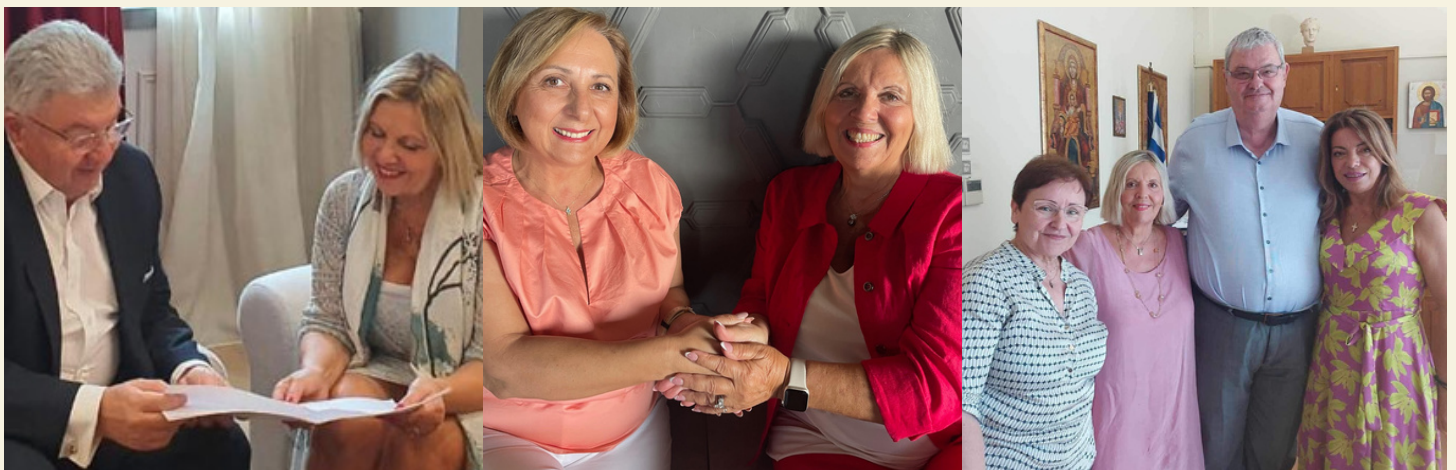
Γενικός Γραμματέας Απόδημου Ελληνισμού και Διπλωματίας, κ. Ιωάννης Χρυσουλάκης

Είμαστε σε επαφή με διάφορα Κυβερνητικά Τμήματα και Μη Κυβερνητικούς Οργανισμούς όπως το Υπουργείο Τουρισμού, το Υπουργείο Οικογενειών και Κοινωνικής Συνοχής, η Γραμματεία Απόδημου Ελληνισμού και Διπλωματίας, η Περιφέρεια Ηπείρου, το Εκπαιδευτικό Γραφείο Ηπείρου, το Πανεπιστήμιο Ιωαννίνων και διάφορους άλλους οργανισμούς που μοιράζονται το όραμά μας.