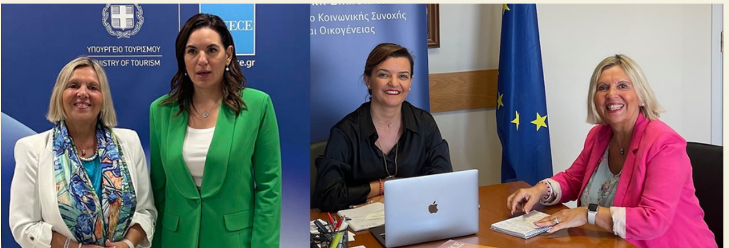
Με την Υπουργό Τουρισμού Όλγα Κεφαλογιάννη